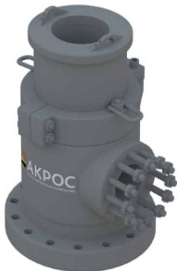
КОРПУС RCD, СЕРИЯ TITAN 5