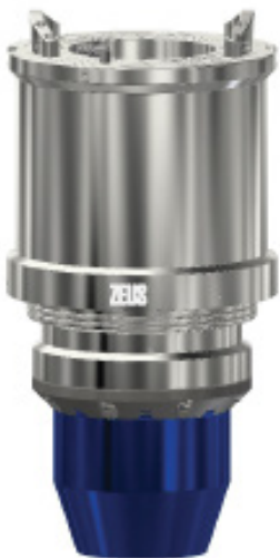
ПОДШИПНИКОВЫЙ УЗЕЛ, ZEUS