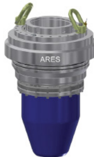
ПОДШИПНИКОВЫЙ УЗЕЛ, ARES